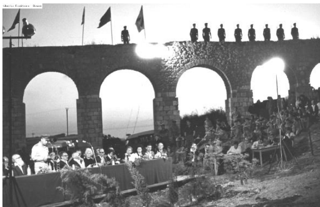
תמונה 3: עצרת 1965, הנואם הוא רא"ל יצחק רבין, ברקע אמת המים העותומנית ארכיון בלה"ג, 36104

בעצרות הראשונות אורגן מרחב העצרת במתכונת "סוציאליסטית" כאשר אל מול הבאים הוקמה הבמה ועליה שולחן נשיאות, שולחן ארוך מכוסה מפה ועליה אגרטלים עם פרחי קאלה (Calla). הצילומים מהעצרות מראים שמשנת 1971 ואילך בוטל שולחן הנשיאות. הנכבדים הושבו בשורה הראשונה של הקהל, יחד עם הציבור, ובהגיע תורם לשאת דברים הם עלו לדוכן הנואמים ואחר כך שבו אל מקומם בקהל. ההפרדה ההיררכית המסורתית בוטלה, והמסר העיצובי נהיה יותר עממי ודמוקרטי.