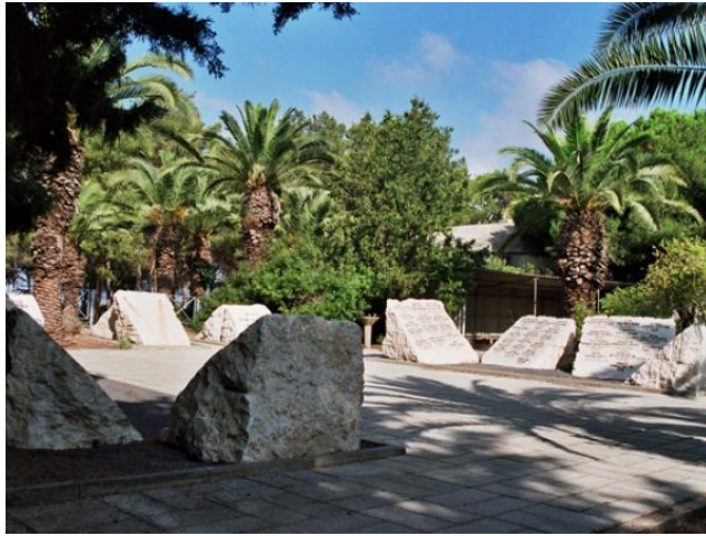
תמונה 4: אתר הזיכרון לבני משפחות חברי קיבוץ לוחמי הגטאות שנרצחו בשואה

מאז מתקיימים בקיבוץ לוחמי הגטאות שני אירועי זיכרון. בערב יום הזיכרון מועלה זכרם של משפחות המייסדים ובמוצאי היום מתקיימת כסדרה עצרת הזיכרון הציבורית. בית הקברות (בדומה לבית הקברות בכנרת), כמו גם מרחב הקיבוץ כולו, הופכים בשנים האחרונות למרחב זיכרון כולל לצד מרחב המוזיאון והתיאטרון הסמוך לו בו מתקיימת עצרת הזיכרון השנתית.