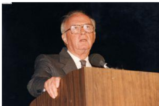
תמונה 8: יצחק רבין בעצרת 1994

הארצי. 63 לצד הדמויות הללו נכחו בעצרת בכל שנות קיומה כמה קבוצות נוספות של אנשי ציבור. הקבוצה הראשונה היא אנשי התנועות האידיאולוגיות ובראשן תנועת הקיבוץ המאוחד, "בעלת הבית": יצחק טבנקין, ישראל גלילי, יגאל אלון, שושיק פרי, נתן טל, אהרון דגן, חגי מרום, מוקי צור, עדנה סולודר, שהתכבדו בדרך כלל בנשיאת דברים. הקבוצה השנייה היא של אישי ציבור ברמה הלאומית והממלכתית, נציגי ההסתדרות ונשיאי המדינה יצחק נבון (1979, 1983), חיים הרצוג (1985, 1992), אפרים קציר (1978), משה קצב, ראובן ריבלין; וכן ראשי ממשלה, שרים ופוליטיקאים: לוי אשכול (1968), גולדה מאיר (1958, 1961, 1972), יצחק רבין (1965 כרמטכ"ל, 1987, 1994), שמעון פרס (1986, 1995), אהוד ברק (1993, 2000), יוסף שפרינצק, יגאל אלון, זבולון המר (1982), שלמה הלל (1988), משה שחל, איציק מרדכי, שמחה דיניץ, שבח וייס, סלאי מרידור, יצחק בן אהרון, ישראל גלילי, גדעון האוזנר.