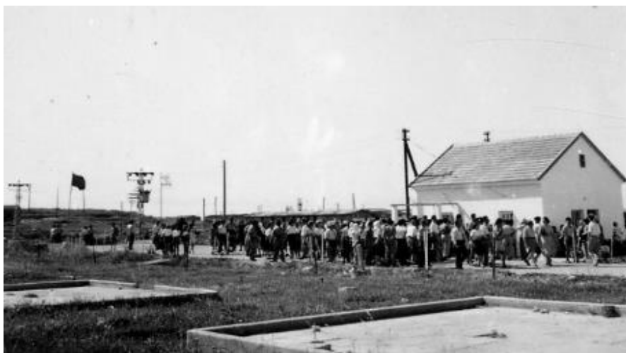
תמונה 1: הבאים לעצרת אפריל 1949. ברקע בניין ששרד מהמחנה הצבאי הבריטי ובו מיקמו המייסדים בחדר אחד את בית התינוקות ובחדר השני את הארכיון ההיסטורי 32

הידיעה בדבר משרטטת תמונה שלמה. הטקס מהדהד. התותחים רועמים מחיפה. הציבור נרגש. לצד דגלי הלאום ו"התקווה" משולבים גם דגלי המעמד ו-"האינטרנציונל". כמה ממרכיבי הקבע של מסורת עצרת הזיכרון כבר נכללו במסכת העצרת הזו. מקום מרכזי ניתן מעתה לשירת הקינה הגדולה של יצחק קצנלסון "השיר על העם היהודי שנהרג" שניצל מהגניזה במחנה הריכוז ויטל בצרפת ולעתיד מצא את מקומו בארכיון בלה"ג. גם "שיר הפרטיזנים" של הירש גליק כבר מצוי היה במסכת, וכך גם בעשרות העצרות שיבואו בשנים הבאות. "הקהל החוגג" – זו האווירה שתלווה את האירוע שנים רבות עד שהעצב יזכה להכרה ויעלה לפני השטח.