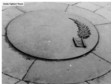
תמונה 1: אנדרטת 1946 ארכיון בלה"ג, 45498

במבט לאחור, הייתה זו ראשיתה של מסורת הטקסים הפומביים לציון זיכרון השואה והמרד בשנים שלאחר מכן. שנתיים אחר כך, במעמד ציבורי רב רושם נחנכה בוורשה בסמוך לאנדרטת 1946 האנדרטה המונומנטלית לזכר מורדי הגטו של הפסל רפפורט. התאריך בלוח השנה - 19 באפריל, כבר התקבע בתודעת הציבור בוורשה. 12 שלוש שנים אחר כך מייסדי הקיבוץ כבר מצאו את דרכם לארץ ישראל. הם התאגדו בגרעיני התיישבות בקיבוצים יגור, בית השיטה וגינזור והתאחדו לשם הקמת קיבוצים החדש אשר ברוב-עם צוין ב-18 באפריל 1949 (כמעט באותו מועד של הטקס בוורשה). היה זה אירוע משולש: לצד הטמנתה של אבן הפינה לציון הקמתו של קיבוץ חדש, קהילה של חיים מתחדשים, היה זה גם יום לידתו של בלה"ג, עת אורגנה תערוכה צנועה של תעודות ופריטים "משם". הצלע השלישית הייתה כינוסה של עצרת הזיכרון הראשונה על אדמת ארץ ישראל, שהפכה לאירוע של קבע ולכינוס הציבורי הגדול בישראל לציון יום השואה. 13 בעלון הקיבוץ הצעיר, דפים, בגיליון מספר 10, כתבו העורכים: