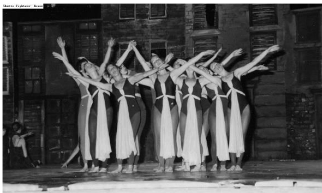
תמונה 9: עצרת 1983

נוסח ה"יזכור" המהווה פתיח של טקס הזיכרון בתוך מסכת יום השואה 70 הוא דוגמה למאבק על דמותה של הליטורגיקה ביום השואה. האם "יזכור אלוהים" את בניו ובנותיו שנספו כבנוסח המסורתי, או "יזכור עם ישראל" כבנוסח שיצא תחת ידיו של ברל כצנלסון והתקבל בחוגי הציונות החילוניים. האם להשתמש בטקסטים של חיים גורי (שנכתב לאנשי הקיבוץ המאוחד) או של אבא קובנר (שנכתב עבור אנשי הקיבוץ הארצי).