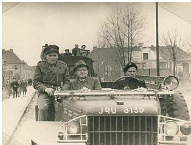
פראגר בביקור במחנה העקורים בברגן בלזן, לובש מדים ויושב ברכב צבאי (גקה"ש)

כל מי שנזדמן לו להיפגש עם השרידים הניצולים בהכרח שתתעורר בו שוב ושוב התמיהה הגדולה: כיצד שמרו אלה על גחלת החיים שלא תיכבה? לא פעם העזתי לשאול אותם על כך. 131