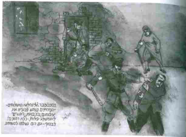
בזמנאסבד 42 נחלשו האסלאחים - הקדדנים נצתו פלוצ'ה את עמותתם: בקבוצת ראשי לאומות: צלמן - נכח רחמים; זבוחי-גם הם שלחו להמדת

פרץ חורשתי (1920-2017), הבאה לשילוח, ספטמבר 1942.