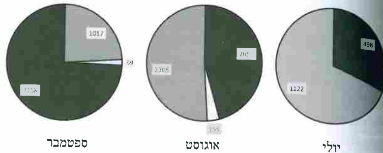
מקרא: ■ סיבות טבעיות (רעב ומחלות); □ התאבדות; ■ ירי

תרשים 3: סיבות המוות של יהודים בחודשי הגירוש הגדול על-פי חודשים